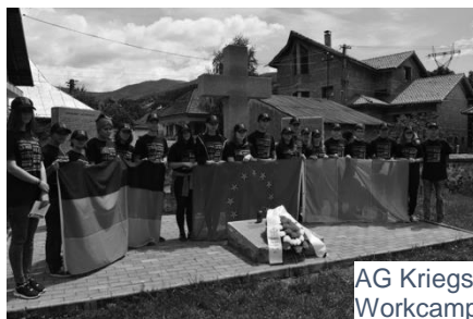
AG Kriegsgräber, Workcamp in Rumänien